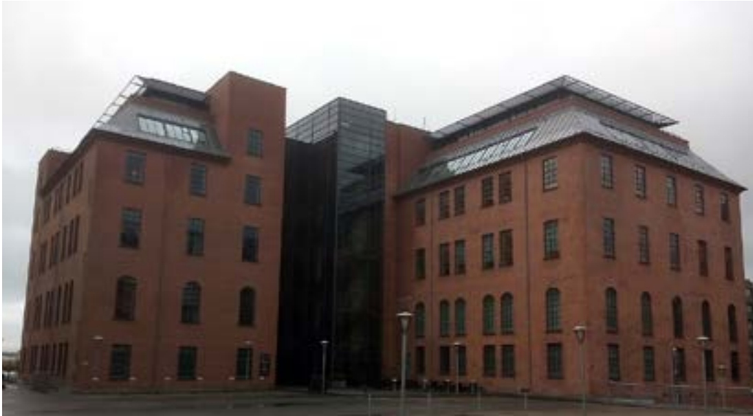
Styrelsen for Patientsikkerhed

savnaðar sum dátur í Landspatientregisteret. Upplýsingarnar kunnu t.d. lýsa, nær og hvar ein sjúklingur er vorðin innlagdur ella lýsa diagnosur, kanningar, viðgerðir hjá sjúklinginum v.m.