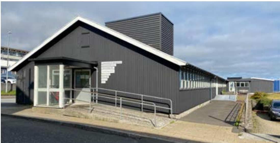
Ílegusavnið og Fólkaheilsuráðið

Ílegusavnið er tann føroyski Biobankin, sum, tá ið ræður um ílegugransking knýtt at ættartrøum, umsitur allar upplýsingar um blóðroyndir, vevnaðarroynir, staðfestar sjúkur og ættarbond hjá føroyingum. Uppgávan hjá Ílegusavninum er at tryggja, at upplýsingarnar eru rættar; verða væl vardar og goymdar trygt. Sambært ílegulógini er endamálið hjá Ílegusavninum at skipa, byggja upp og fyrisita Vevnaðarskránnu, Diagnosuskránnu og Ættarbandskránnu; at viðgera umsóknir um loyvi til at granska í upplýsingunum í skránum, herundir at krevja gjald fyri tær veitingar og upplýsingar, sum Ílegusavnið gevur atgongd til. Sambært Ílegulógini, skulu skráirnar bert innihalda upplýsingar, sum eru ella kunnu verða viðkomandi fyri ílegugransking. Endamálið er eisini at skapa fortreytir fyri og stimbra gransking í mannailegum í Føroyum, soleiðis at slík gransking kann vera við til, at: 1) menna førleikan at lekja og fyrirbyggja sjúkum; 2) menna almennu heilsutænastuna og 3) menna granskingarumhvørvið.