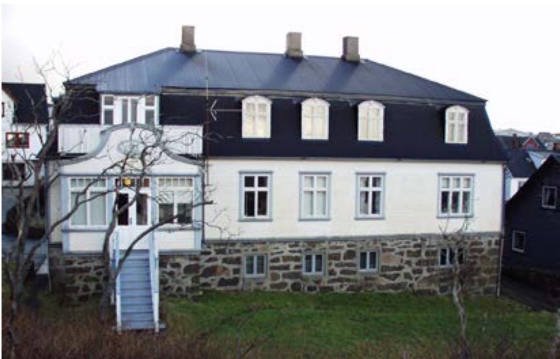
Deildin fyri Arbeiðs- og Almannaheilsu

Deildin fyri Arbeiðs- og Almannaheilsu arbeiðir í høvuðsheitum við at granska, hvussu umhørvrið ávirkar heilsuna hjá fólki og við at lýsa fólkaheilsuna í Føroyum. Deildin hevur savnað eitt sera stórt tilfar við vísindaligum upplýsingum um føroyingar. Serliga kohortukanningarnar við lívsins byrjan eru rúgvusmiklar. Harafturat vekstur virði á hesum kanningum í atljóða granskingarhøpi. Talan er um viðkvæmar persónsupplýsingar um heilsuviðurskipti hjá navngivnum einstaklingum. Deildin fyri Arbeiðs- og Almannaheilsu